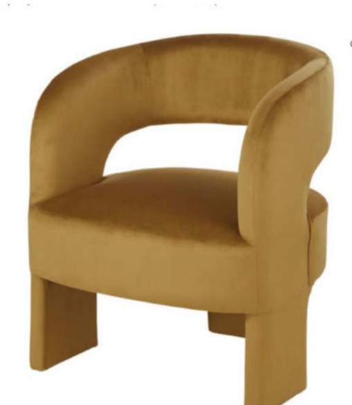
3 BUTACAS * COMPRAR*