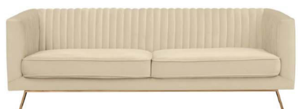
2 sofás de 3 plazas existentes TVE