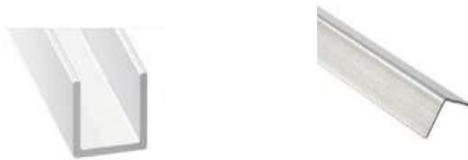
Pieza metálica en forma de U o L.

-Piezas en forma de U para sujeción de los metacrilatos en la parte inferior y superior. Medida 10 cm de alto, a modo de zócalo, por el ancho de la pieza 130 cm y el grosor del metacrilato, insertado en su interior.