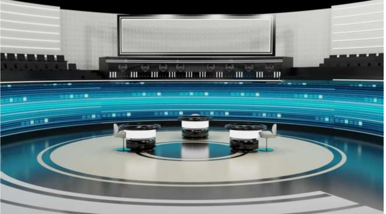
B) fabricación e instalación de costados

Fabricación y montaje de dos costados de Dm de 19 mm sobre estructura metálica existente.