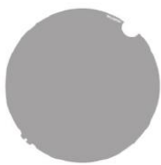
17° x 46° WallWash Filter (AX5-WWF (included))