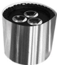
Mirrored Flex Cover (AX5-FLXVR-MIR)