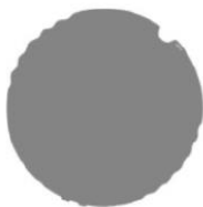
32° Flood Filter (AX5-FF (Included))